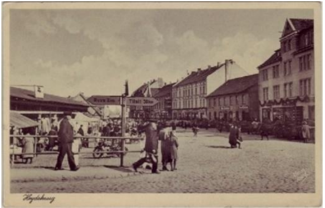
Viešbutis „Germania“ XX a. 4 dešimt.

Ženklo spalvos: raudona, balta, juoda. Parinktos naudojant Pamario kraštui būdingų vėtrungių spalvos gamą. Vėtrungės žvejai tvirtindavo ant burlaivio stiebo, jų spalvos ir naudojami elementai, parodydavo iš kokio miestelio yra atplaukę žvejai. Pagrindinė vėtrungių paskirtis – rodyti vėjo kryptį.