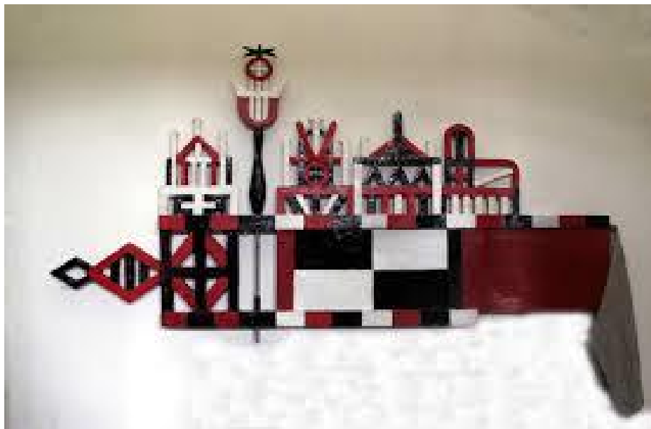
Pamario kraštui būdingos vėtrungės spalvų gamos pavyzdys.

Ženklo spalvos: raudona, balta, juoda. Parinktos naudojant Pamario kraštui būdingų vėtrungių spalvos gamą. Vėtrungės žvejai tvirtindavo ant burlaivio stiebo, jų spalvos ir naudojami elementai, parodydavo iš kokio miestelio yra atplaukę žvejai. Pagrindinė vėtrungių paskirtis – rodyti vėjo kryptį.