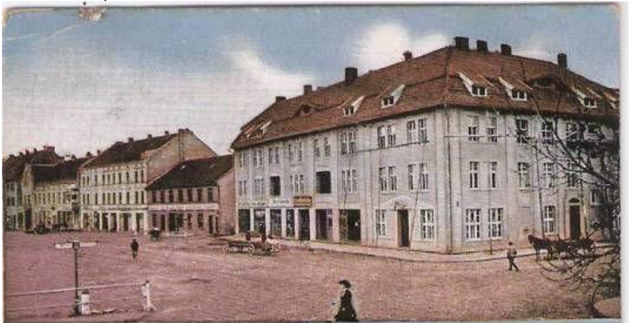
Viešbutis „Germania“, 1916 m. Atvirukas.